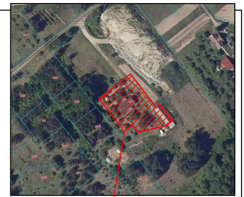
Objekto vieta. Schema