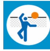
Aktyvaus poilsio zona