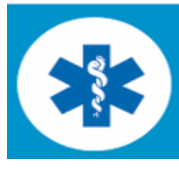
Pirmoji medicinos pagalba