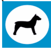
Zona, skirta lankytis su gyvūnais