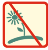
Skinti ar naikinti saugomų rūšių augalus