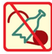
Vartoti alkoholinius gėrimus