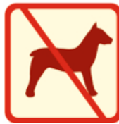
Lankytis su gyvūnais