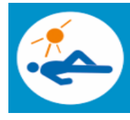
Pasyvaus poilsio zona